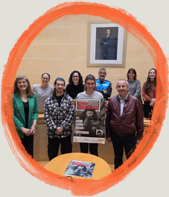
PARTICIPACIÓN EL PLENO DEL AYUNTAMIENTO DESDE EL PROGRAMA DE PERSONAS SIN HOGAR