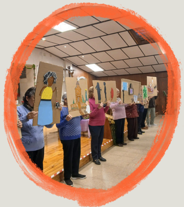
ENCUENTRO NAVIDEÑO INTERGENERACIONAL