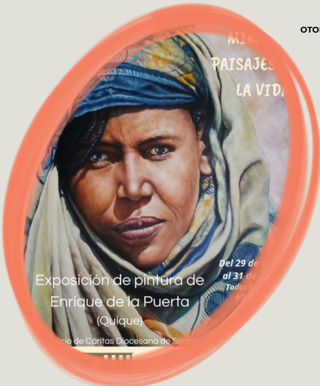
Exposición de pintura de Enrique de la Puerta (Quique)