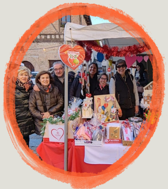
PARTICIPACIÓN DE LA CARITAS PARROQUIAL EN EL MERCADILLO SOLIDARIO DE SAN LORENZO