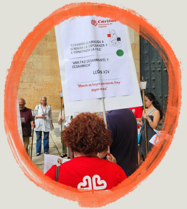
MISA JUBILEO 2025