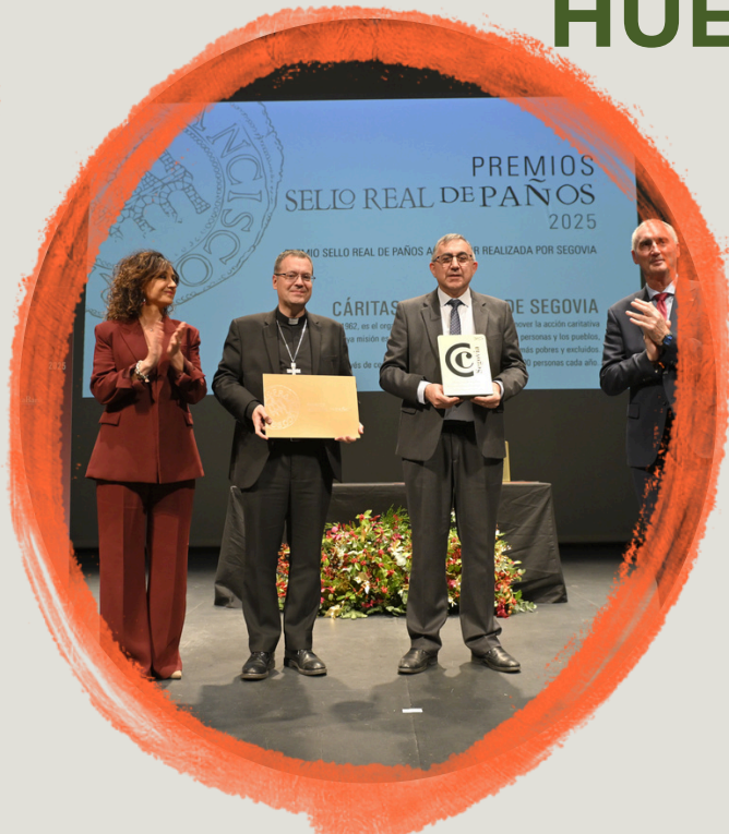
PREMIOS SELLO REAL DE PAÑOS 2025 OTORGADOS POR LA CÁMARA DE COMERCIO DE SEGOVIA.