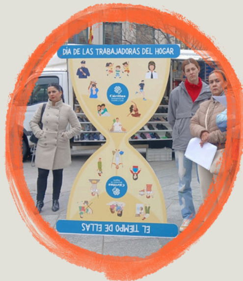
DÍA DE LAS TRABAJADORAS DEL HOGAR