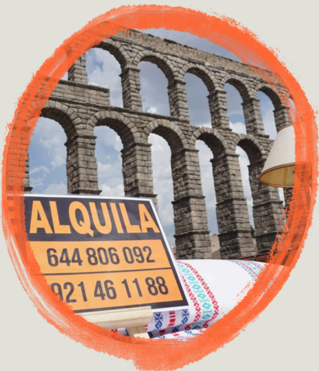
EXPOSICIÓN POR EL DERECHO A LA VIVIENDA